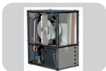
Terra-CL: la pompa di calore ad aria, vista interna