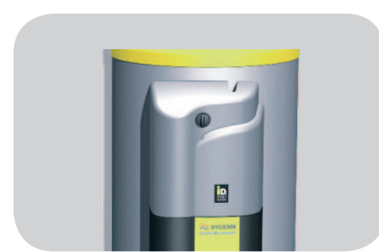
Comfort ed igiene con acqua sanitaria à-la-carte