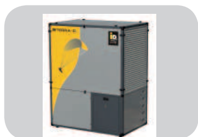
Terra-CL: la pompa di calore ad aria per riscaldamento ed acqua calda sanitaria