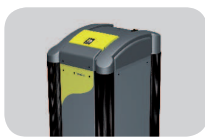
Ancora più risparmio con la pompa di calore Terra